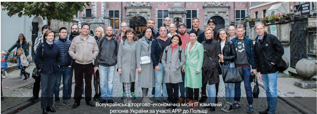
Всеукраїнська торгово-економічна місія ІТ компаній регіонів України за участі APP до Польщі

У підсумку хочеться наголосити, що фахівці Черкаської агенції регіонального розвитку завжди готові ділитися знаннями та досвідом задля розвитку регіону.